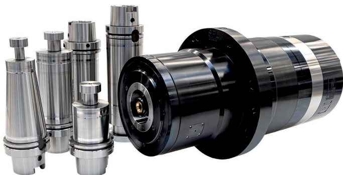
3 Beispielhafte Motorspindel von SPL des Typs SPL 2780.0 mit 75 \text{ Nm} Drehmoment, Maximaldrehzahl 18000 \text{ min}^{-1} und verschiedenen HSK-A100-Werkzeugaufnahmen

Die Lagerung der Spindel selbst erfolgt in hochgenauen Lagern der Präzisionsklasse P4, die unter definierter Vorspannung in der Gehäusebohrung eingebaut sind. Dadurch weisen sie eine gleichförmige Lastverteilung in jedem einzelnen Lager auf, was wiederum die Basis für eine überdurchschnittlich lange Lebensdauer und eine verringerte Temperaturentwicklung im Gesamtsystem ist. Der maximal zulässige Rundlauf – gemessen an der Werkzeugaufnahme – ist mit 0,002 \text{ mm} im untersten Bereich des mechanisch Machbaren angesiedelt.