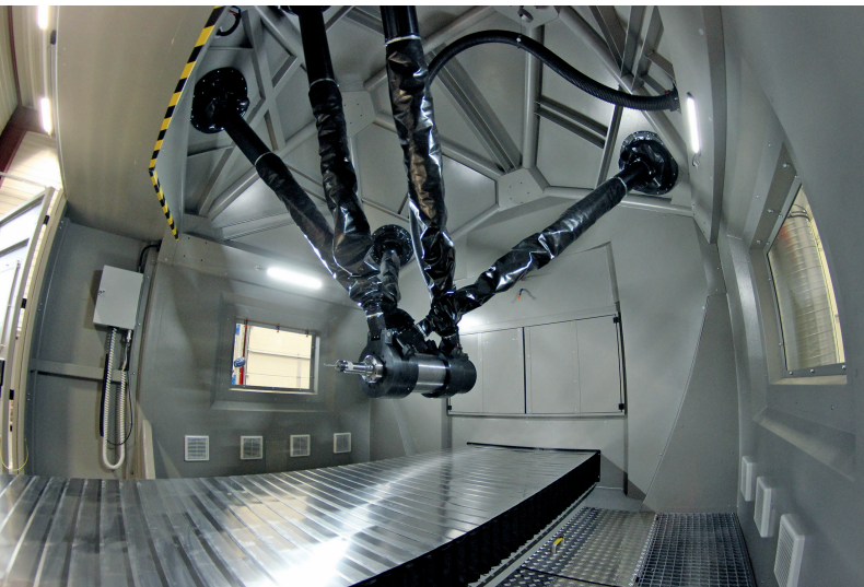
1 Blick in den Arbeitsraum der Hybrid-Werkzeugmaschine von Metrom und auf die eigensteife 5-Achs-Parallelkinematik für die additive und subtraktive Fertigung

Die Herausforderungen bei der additiven Fertigung und der fast immer notwendigen Nachbearbeitung sind enorm. Eine möglichst hohe Produktivität fordert immer höhere Auftragsraten, wobei zugleich die Güteaspekte ›Materialhomogenität‹ und ›Oberflächenqualität‹ das Niveau der bisherigen Fertigungsverfahren erreichen oder gar übertreffen sollen. Zudem müssen sich die Anwender bei der Auswahl eines Anbieters entscheiden, ob die Auslegung des Maschinenparks auf der Kunststoff- oder der Metallbearbeitung basiert, schließlich unterscheiden sich diese gravierend bezüglich der Systemsteifigkeit und -genauigkeit sowie hinsichtlich der Anschaffungskosten.